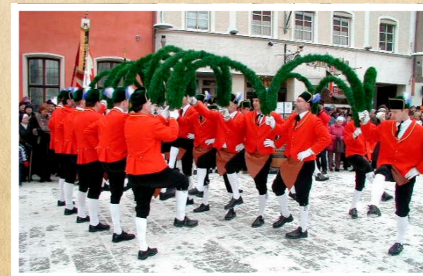
zum Abschluss der Laubengang