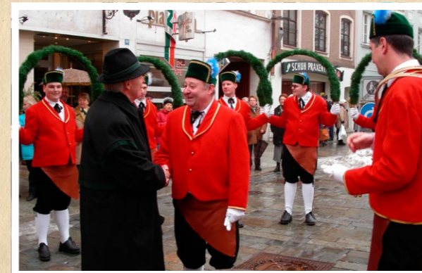
Begrüßung des Tanzspenders